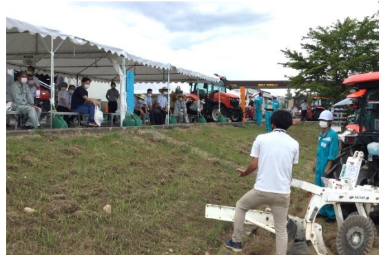
前年 排水対策実演会の様子

水田での園芸品目栽培を行う際に重要となる排水対策作業について実演を行う他、事前に施工した圃場との排水性の比較もぜひ現場でご確認ください。